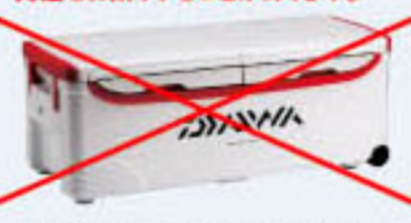
写真は DAIWAランク大特 50リットル