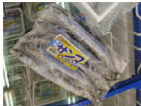
釣具店の小型サンマ5尾入り 1日分で2~3袋