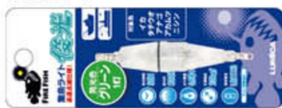
参考: LUMICA 俊光 グリーンLED高速点滅