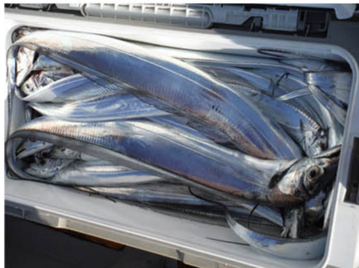
タチウオテンヤ40号