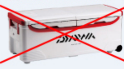
写真は DAIWAランク大特 50リットル