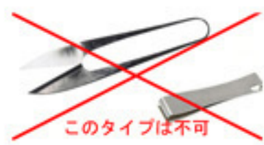
このタイプは不可