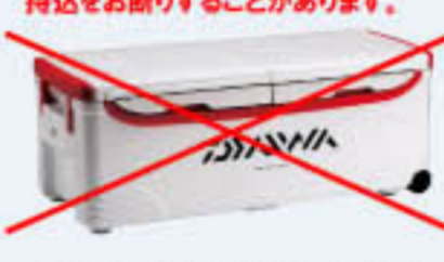
写真は DAIWAランク大特 50リットル