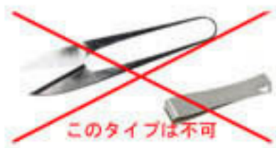
このタイプは不可