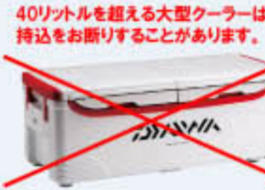
40リットルを超える大型クーラーは 持込をお断りすることがあります。 写真は DAIWAランク大特 50リットル