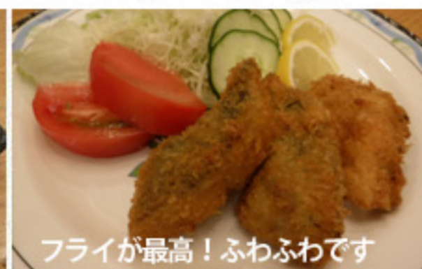
フライが最高！ふわふわです