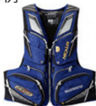
フローティングベスト