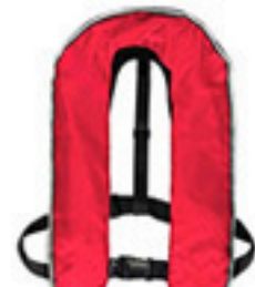
桜マークなし 膨張式安全具